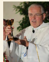
Reverendísimo Donald Hanchon Obispo Emérito de Detroit, Michigan