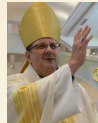
Reverendísimo Gregory Parkes Obispo de St. Petersburg, Florida